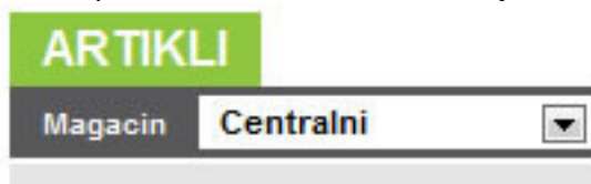
Slika 6: Izbor magacina

Sa leve strane prozora za poručivanje, pri vrhu, nalazi se lista sa magacinima iz kojih možete da poručujete robu. Na porudžbinu možete da dodajete artikle iz više magacina.