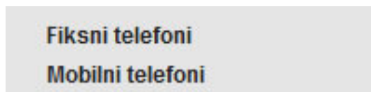
Slika 7: Katalogi izabranog magacina

Kada ste izabrali željeni magacin, ispod njega će se pojaviti spisak sa katalogizima tog magacina.