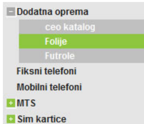
Slika 8: Spisak podkataloga

Kada izaberete željeni katalog pojaviće se lista podkataloga, ukoliko ih ima, a ukoliko ih nema, sa desne strane, pojaviće se spisak artikala iz tog kataloga. Katalog koji sadrži podkataloge sa leve strane ima znak „+“. Sve artikle iz takvog kataloga možete videti ako izaberete „-ceo katalog“.